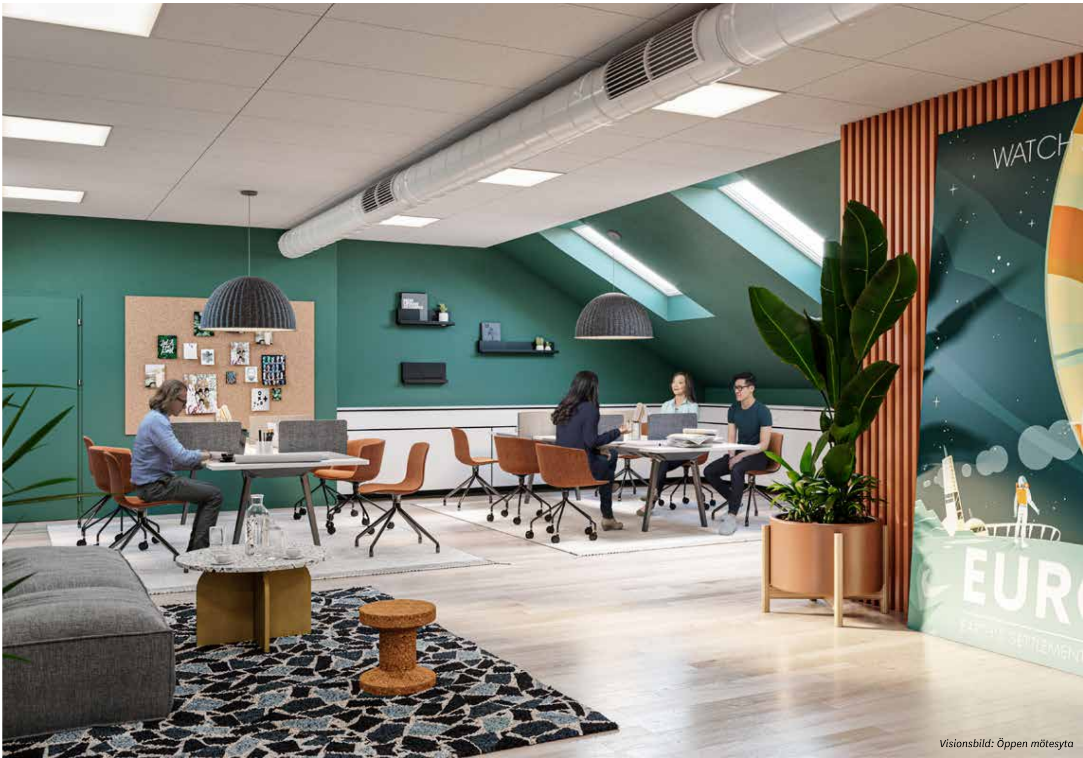
Visionsbild: Öppen mötesyta