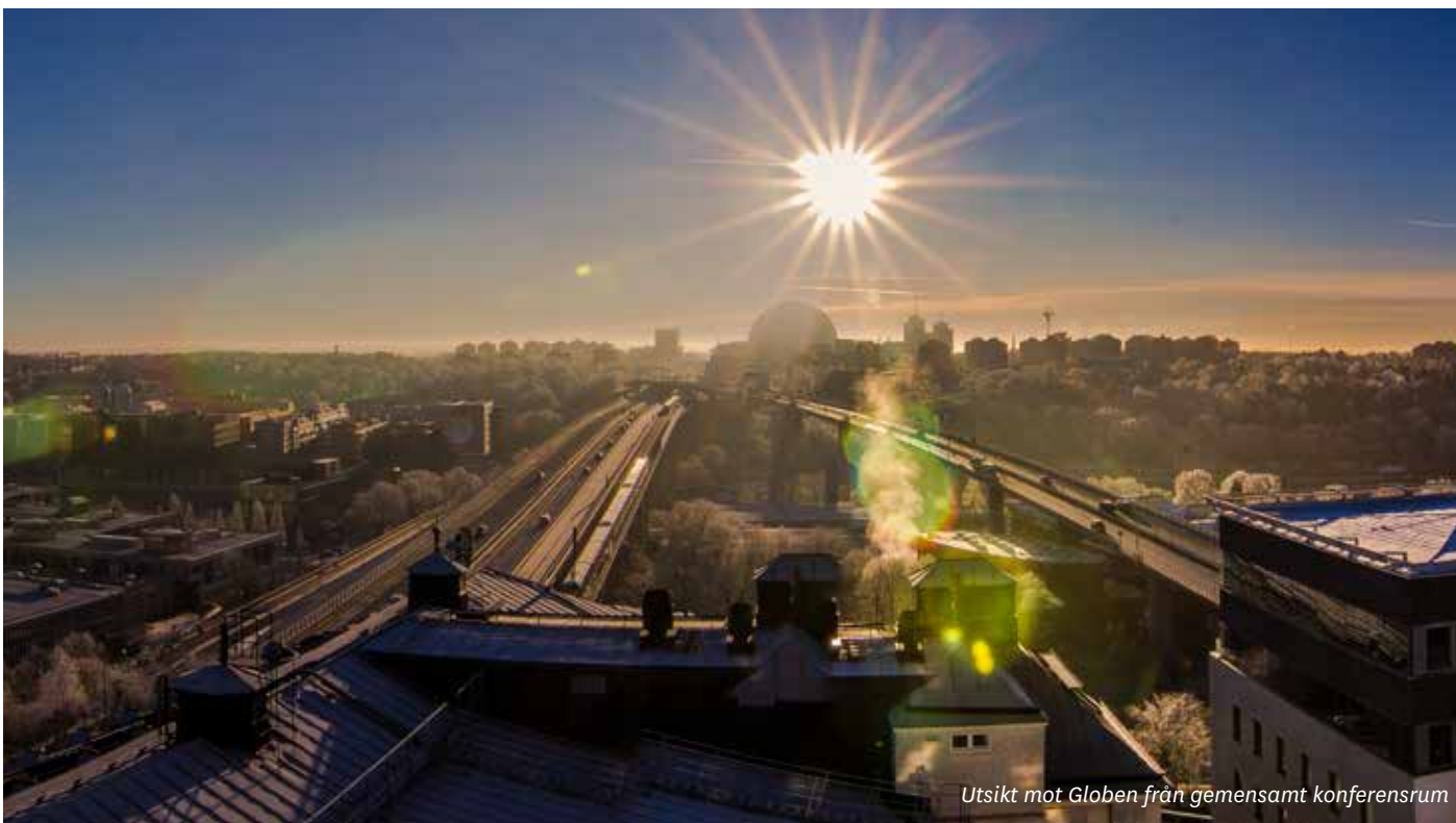
Utsikt mot Globen från gemensamt konferensrum