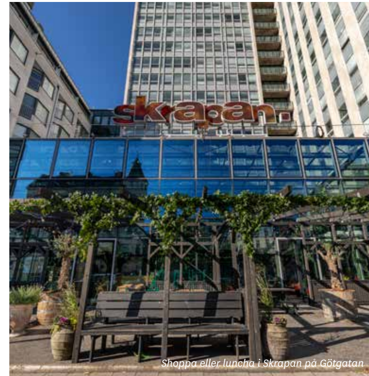
Shoppa eller luncha i Skrapan på Götgatan