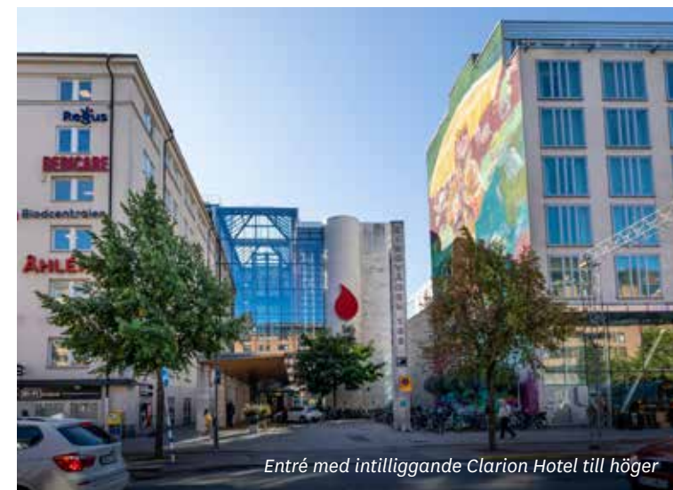
Entré med intilliggande Clarion Hotel till höger