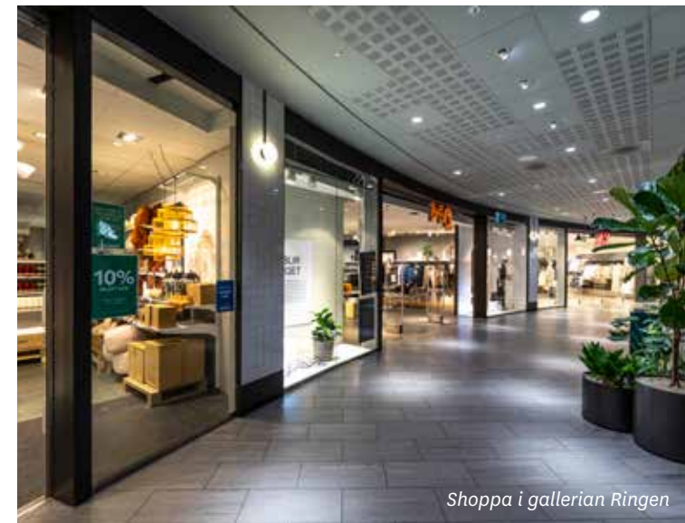
Shoppa i gallerian Ringen