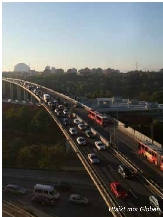
Utsikt mot Globen