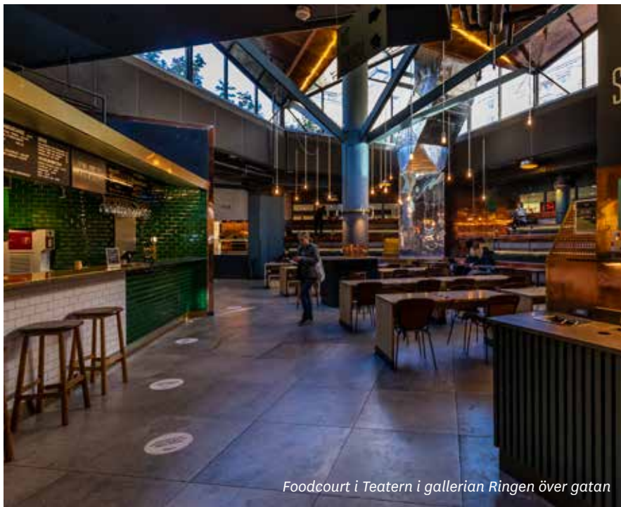
Foodcourt i Teatern i gallerian Ringen över gatan