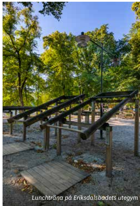
Lunchträna på Eriksdalsbadets utegym