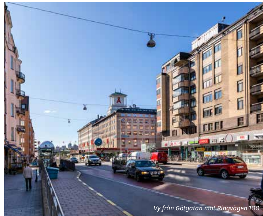
Vy från Götgatan mot Ringvägen 100