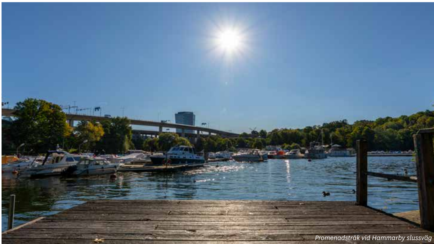
Promenadstråk vid Hammarby slussväg