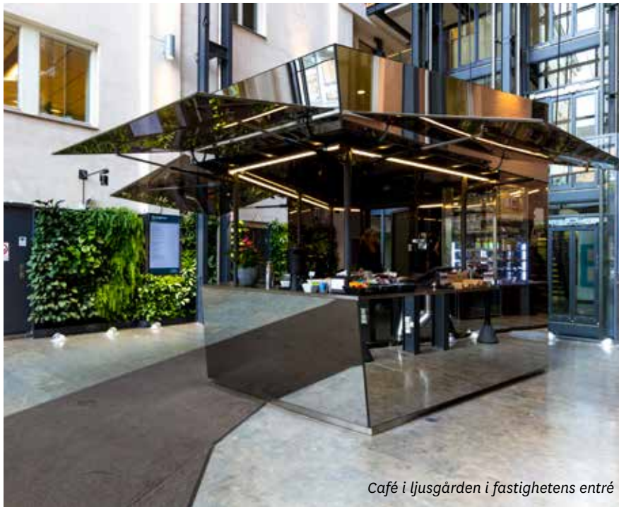
Café i ljusgården i fastighetens entré