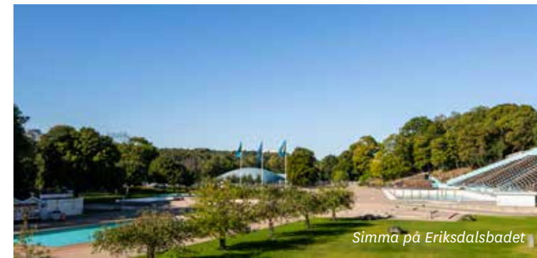
Simma på Eriksdalsbadet